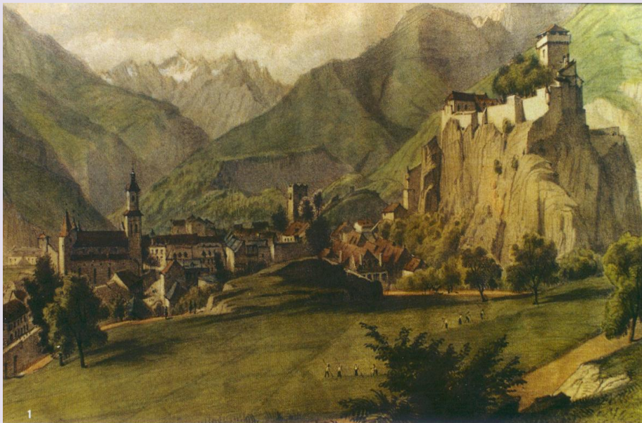
1. Visione di Lourdes in stile romantico, dove la montagna deve apparire spaventosa. A sinistra la chiesa collegiale e parrocchiale Saint Pierre de Lourdes. Al centro la torre di Guigne nel quartiere di Garnavie e a destra il castello.

Erano già molti giorni che pensavo al mio prossimo viaggio a Lourdes. L'anno scorso, la stessa gita mi aveva molto bene impressionato ed adesso non vedevo l'ora di ripetere l'esperienza.