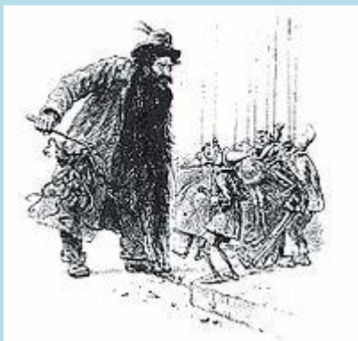
Il burattinaio Mangiafoco

da mangiare: trova un uovo, ma quando lo rompe ne esce un pulcino. Prova a chiedere un po' di pane in una casa del paese, ma rimedia soltanto una secchiata d'acqua in testa. Tornato a casa affamato e inzuppato d'acqua, si addormenta vicino a un braciere per asciugarsi mettendo incautamente i piedi sul braciere. Quando Geppetto l'indomani viene rilasciato dalla prigione, trova Pinocchio piangente con i piedi bruciati; lo sfama con tre pere che aveva portato dal carcere e gli ricostruisce i piedi: Pinocchio, fuori di sè dalla gioia, promette di andare a scuola, così Geppetto gli prepara un vestito di carta e compra un abbecedario vendendo la propria giacca, nonostante il gelo invernale.