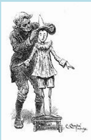
Geppetto veste Pinocchio

Nella bottega del falegname mastr'Antonio detto mastro Ciliegia (per via del colore del suo naso sempre rosso) si trova un pezzo di legno di poco valore, che il falegname intende trasformare in una gamba di tavolino. Quando mastro Ciliegia però si accorge che il pezzo di legno comincia a parlare, spaventato lo regala all'amico Geppetto , detto Polendina per via del colore della sua parrucca gialla, capitato in quel momento nella sua bottega per chiedergli un pezzo di legno per costruire un burattino [2] , con il quale girare tutto il mondo per guadagnarsi da vivere.