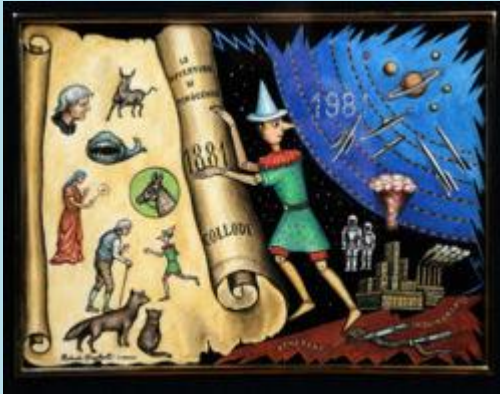
Allegoria di Pinocchio, R. Dughetti