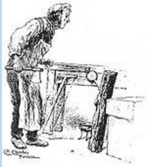
Mastro Ciliegia osserva stupito il tronco

Nella bottega del falegname mastr'Antonio detto mastro Ciliegia (per via del colore del suo naso sempre rosso) si trova un pezzo di legno di poco valore, che il falegname intende trasformare in una gamba di tavolino. Quando mastro Ciliegia però si accorge che il pezzo di legno comincia a parlare, spaventato lo regala all'amico Geppetto , detto Polendina per via del colore della sua parrucca gialla, capitato in quel momento nella sua bottega per chiedergli un pezzo di legno per costruire un burattino [2] , con il quale girare tutto il mondo per guadagnarsi da vivere.