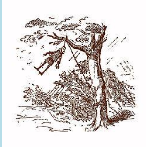
Enrico Mazzanti. Illustrazione per l'edizione del 1883: Pinocchio impiccato alla quercia grande.