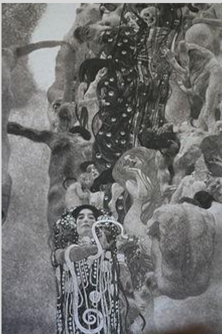
Medicina , 1900

In seguito alla crisi della Secessione viennese, Klimt si avvicina ai neonati Wiener Werkstätte ( Laboratori Viennesi ) e la mostra del 1908 conterrà una sezione dedicata esclusivamente a sedici sue opere. La collaborazione continua anche nel 1905 con la decorazione di Palazzo Stoclet, dimora dell'industriale Apolphe Stoclet progettata da Josef Hoffmann a Bruxelles, con il fregio musivo della sala da pranzo. I 9 disegni ideati da parte di Klimt oggi si trovano nella collezione permanente del Museum für angewandte Kunst a Vienna.