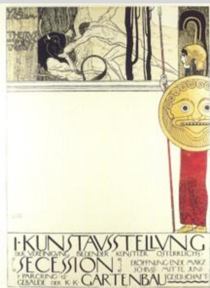
Manifesto per Ver sacrum , 1898

Nel 1898 si inaugura la prima mostra della Secessione viennese, movimento artistico costituitosi l'anno prima con Klimt presidente. La secessione pubblica una propria rivista, Ver Sacrum (primavera sacra) di cui verranno pubblicati 96 numeri, fino al 1903. Alla prima mostra vengono esposte opere dello stesso Klimt, di Auguste Rodin, Puvis de Chavannes, Arnold Böcklin, Alfons Mucha e Fernand Khnopff [1] . La seconda mostra inaugurerà il Palazzo della Secessione, appositamente progettato da Joseph Maria Olbrich con elementi greco-egiziani: all'ingresso venne collocata la frase A ogni tempo la sua arte, all'arte la sua libertà .