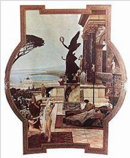
Il Teatro Antico di Taormina , Burgtheater, Vienna

Egli nacque a Vienna, 14 luglio 1862 e morì a Neubau, 6 febbraio 1918 è stato un pittore austriaco, uno dei massimi esponenti dell'Art Nouveau (stile Liberty, in Italia), protagonista della secessione viennese. Gustav Klimt nasce nel 1862 a Baumgarten, quartiere di Vienna, secondo di sette fratelli. Il padre Ernst, immigrato boemo, è orafo, la madre, Anna Finster, appassionata di musica lirica. Le condizioni economiche della famiglia, già compromesse, diventano precarie dopo la crisi economica del 1873 causata dal fallimento dell'Esposizione Universale di Vienna.